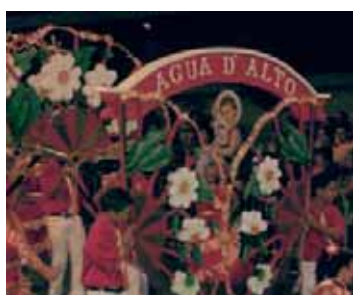
Marcha Água d'Alto

Boletim Informativo da Junta de Freguesia de Água D'Alto. N.º 5 – Julho de 2008.