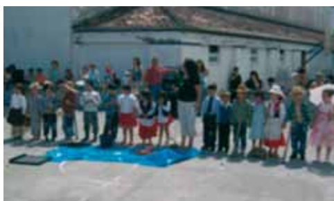
Encerramento actividades lectivas