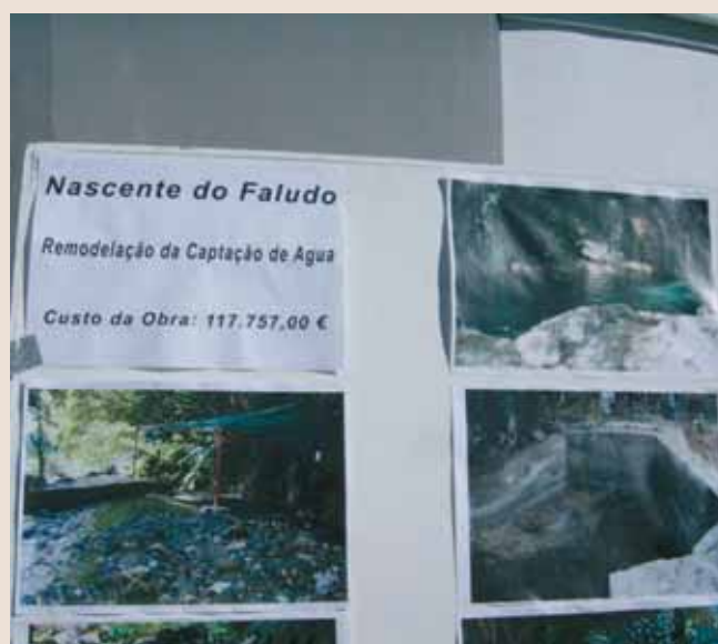
Antes das obras (2007)