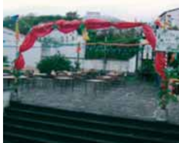
Festa de Santo António

Junta de Freguesia Publica Livro sobre História da Freguesia