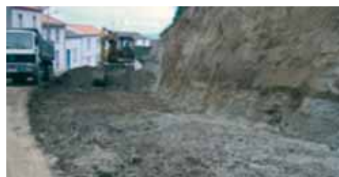
Construção Parque Estacionamento na Rua da Cruz