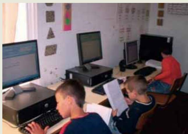
Algumas actividades realizadas pelos alunos no Projecto

Durante este ano lectivo 2007/2008 todos os alunos/professores da Escola EB1/JI Francisco de Medeiros Garoupa, na freguesia de Água d'Alto, estão a dinamizar o Projecto “Fonte de Conhecimentos.” Este Projecto tem como objectivo o acesso às novas tecnologias, aumentar o sucesso educativo dos alunos, desenvolver o gosto pela leitura, incrementar a participação dos pais/encarregados de educação nas actividades da escola, entre outros.